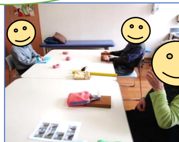
周りの方々と お話ししながら♪